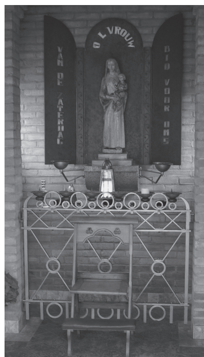
Het interieur van de Hoofdplaatse kapel. Laten we er zuinig op zijn. Hulde aan hen die deze kapel verzorgen.