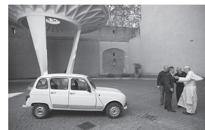
Paus ontvangt de witte Renault 4.

Onze parochie bouwen we samen. Bouwt u mee!!!